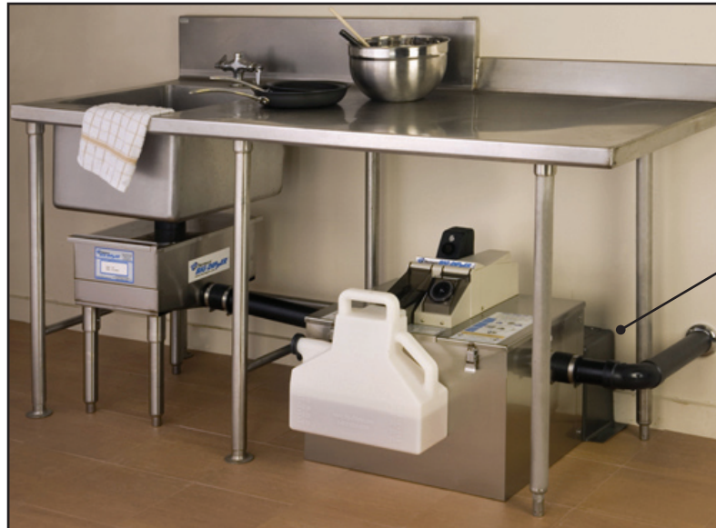
CZONE-1 Zona Limpia™

La Zona Limpia™ Cubierta Sanitaria de Big Dipper® (Parte # CZONE-1) evita la caída de partículas de comida y otros residuos alimenticios que se pueden acumular entre la pared y la parte trasera de la unidad Big Dipper. Esta opción también le proporciona facilidad para limpiar alrededor de la unidad Big Dipper. El tamaño adecuado de la Zona Limpia™ se acopla con las Unidades Automáticas Big Dipper para Eliminar la Grasa en el Punto de Origen modelos W-200-IS, W-250-IS y W-250-AST. También se puede cortar al momento de instalarse para adaptarse alrededor de las molduras del piso o tuberías del drenaje. Fabricado con materiales durables como la resina ABS, permitiéndole que la modificación durante su instalación sea fácil y sencilla, especialmente entre espacios angostos entre la pared y la unidad Big Dipper.